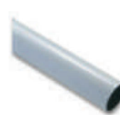
WA7 ramię aluminiowe, tubowe 90 x 6250 mm, zalecane do wietrznych miejsc