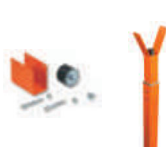
WA11 podpora ramienia stała, regulowana wysokość