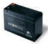
B12-B akumulator 12V 6.0 Ah