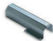
WA4 uchwyt mocujący do ramienia tubowego WA3