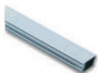
WA1 ramię aluminiowe, płaskie 36 x 73 x 4250 mm