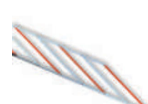
WA13 listwy aluminiowe, zabezpieczające, pod ramię płaskie, w odc. 2 m