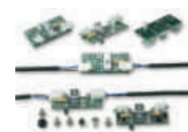
WA9 lampki ostrzegawcze LED na ramię, montowane w listwach ochronnych WA2/WA6 - 6 szt