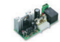
CARICA karta ładowania akumulatorów B12-B