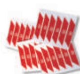
WA10 nalepki ostrzegawcze na ramię szlabanu (24 szt)