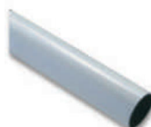
WA3 ramię aluminiowe, tubowe 70 x 4250 mm, zalecane do wietrznych miejsc