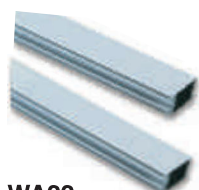
WA22 ramię aluminiowe, płaskie, z łącznikiem, 2-częściowe 36 x 94 x 3125 mm