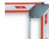
WA14 łącznik do ramienia łamanego - płaskiego WA1