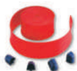
WA2 listwy ochronne, gumowe, czerwone, na ramię WA1