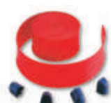
WA6 listwy ochronne, gumowe, czerwone, na ramię WA21, WA22