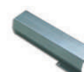
WA8 uchwyt mocujący do ramienia tubowego WA7